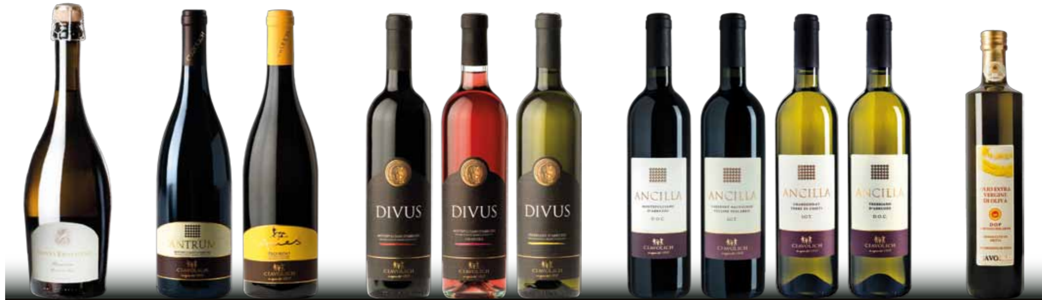
DONNA ERNESTINA Passerina - Spumante Brut