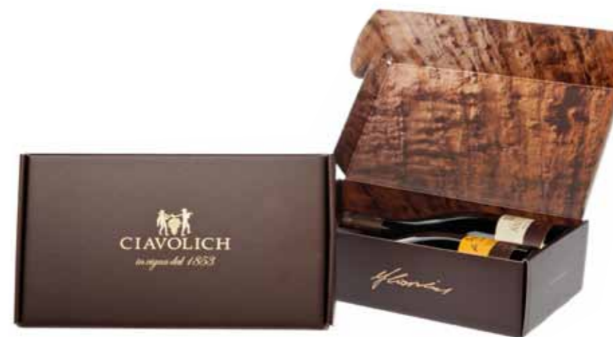
CONFEZIONE GIOIELLO LINEA TOP - Cod. 14 1 Aries Pecorino Igt Colline Pescaresi 2012 1 Antrum Montepulciano d'Abruzzo Doc 2006