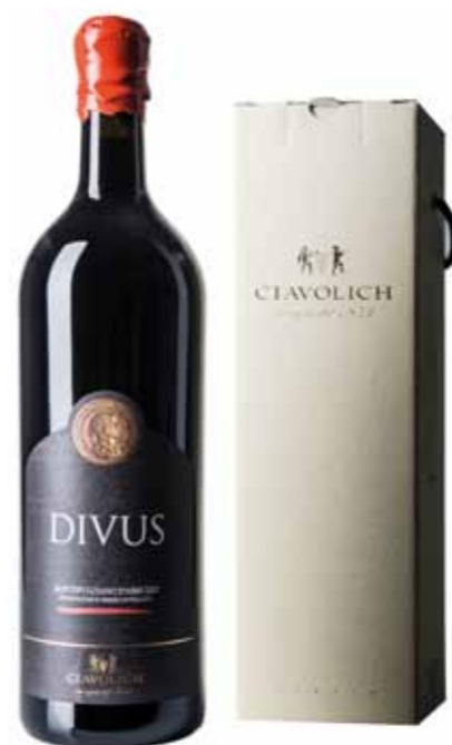
JEROBOAM DIVUS - Cod. 13 1 Divus Montepulciano d'Abruzzo 2010 - lt 3