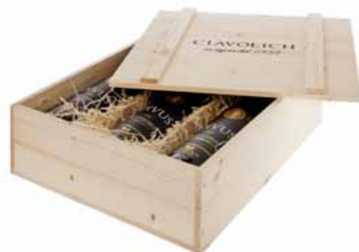
Confezione MEDIA LEGNO