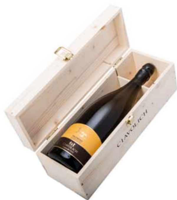
MAGNUM PECORINO - Cod. 12 1 Aries Pecorino Igt Colline Pescaresi 2012

... OPPURE SE PREFERISCI SCEGLI UNA DELLE NOSTRE confezioni Prestige