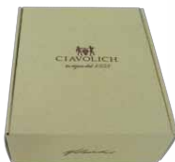
Confezione MEDIA CARTONE