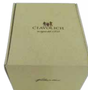
Confezione MAXI CARTONE