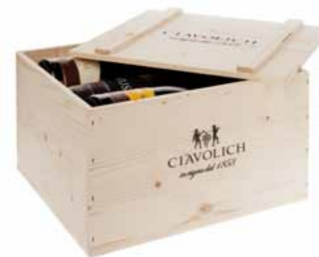
Confezione MAXI LEGNO